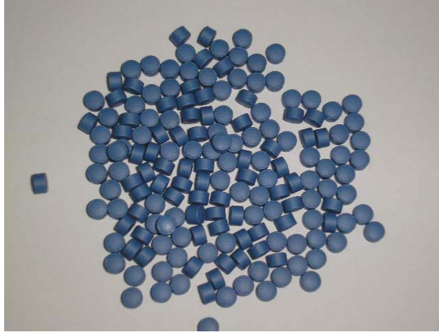
2. ábra Szervetlen hordozóra adszorbeált fehérje hatóanyagot tartalmazó tabletták